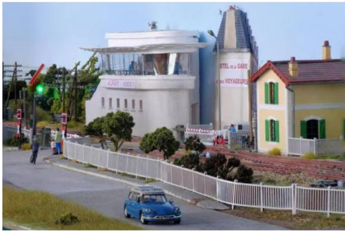
Près du passage à niveau, le poste numéro un, poste d'aiguillage principal. | SÉNÉ RAIL MINIATURE

Jardin cheminot bordant les voies, grue pour décharger le long de rails (toujours visible aujourd'hui)... La maquette reprend le bâti depuis le passage à niveau jusqu'à la rotonde et au dépôt de charbon (qui se situait au-delà du bâtiment voyageurs actuel).