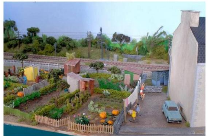
Les jardins cheminots, le long des voies ferrées. | SÉNÉ RAIL MINIATURE