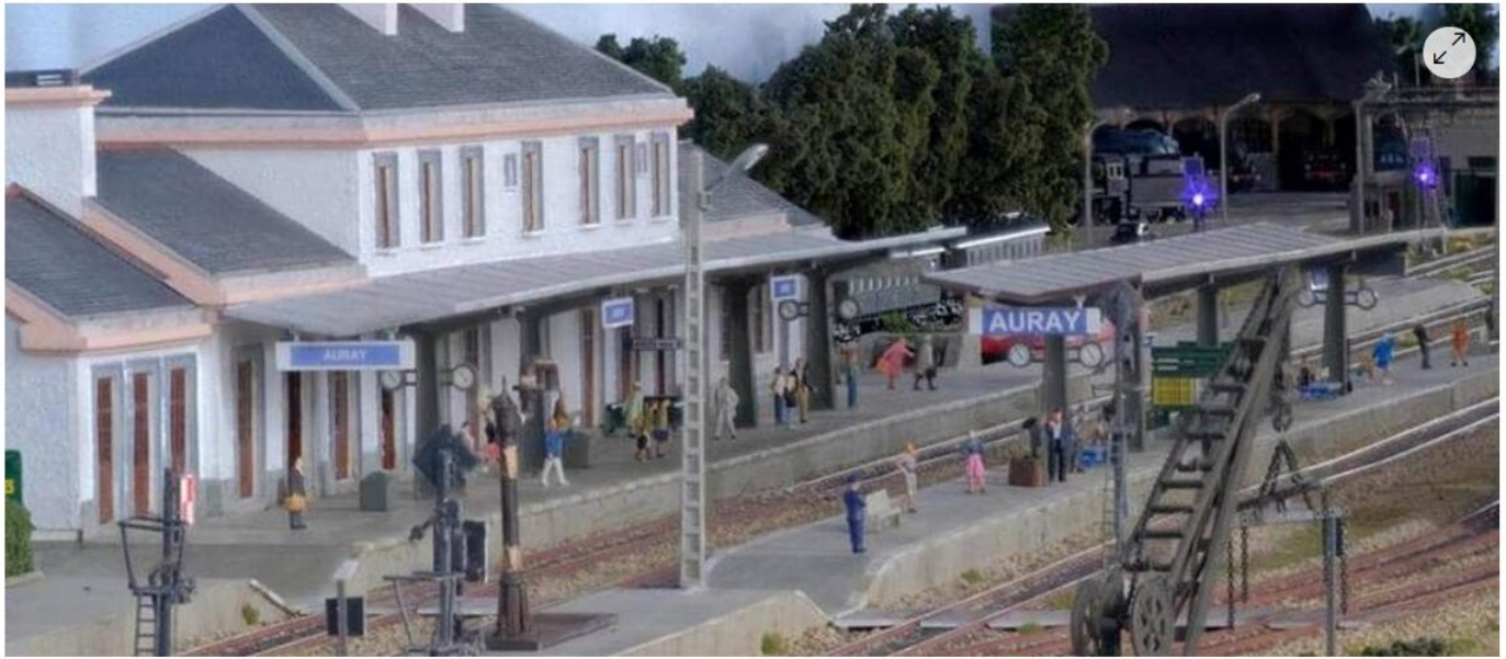
Dix à vingt personnes, membres du club Séné rail miniature, ont travaillé à la construction de la maquette de la gare d'Auray.

Le Pôle d'échanges multimodal d'Auray (Morbihan) sera inauguré cette semaine. Parmi les animations à découvrir, dès ce lundi 13 septembre 2021 : une maquette de treize mètres de long, reproduction de la gare d'Auray dans les années 1960 à 1970.