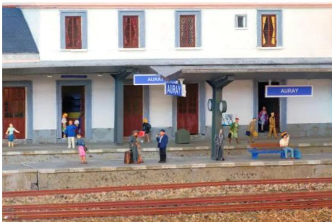
La maquette est peuplée de personnages, voyageurs et personnels SNCF.