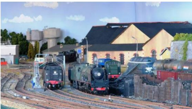
Dix à vingt personnes, membres du club Séné rail miniature, ont travaillé à la construction de la maquette. | SÉNÉ RAIL MINIATURE

Sa taille ? Treize mètres de long sur un à deux mètres. Pour transporter ses 22 m 3 , un camion a été nécessaire, ce week-end, puis huit personnes pour la monter. Ce lundi 13 septembre 2021, à partir de 14 h 30, le public pourra découvrir cette maquette, reproduction animée de la gare d' Auray (Morbihan) dans les années 1960 à 1970. Une incursion dans le passé au moment où la gare ouvre un autre chapitre de son histoire avec le Pôle d'échanges multimodal (Pem), qui sera inauguré samedi 18 et dimanche 19 septembre.