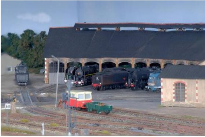
La rotonde, grand bâtiment à alcôves où étaient entretenues les machines. | SÉNÉ RAIL MINIATURE

Jardin cheminot bordant les voies, grue pour décharger le long de rails (toujours visible aujourd'hui)... La maquette reprend le bâti depuis le passage à niveau jusqu'à la rotonde et au dépôt de charbon (qui se situait au-delà du bâtiment voyageurs actuel).