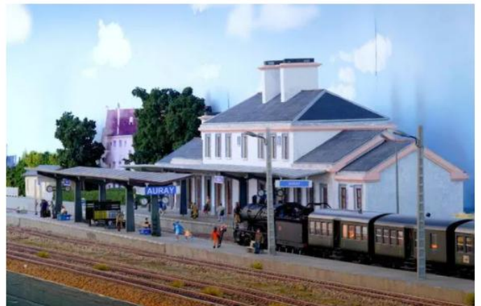
La maquette de la gare d'Auray a nécessité une dizaine d'années de travail.